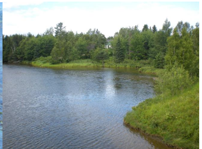
Exemple d'une zone riveraine naturelle et en santé