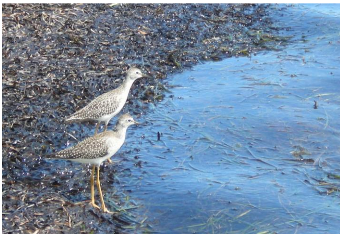
Exemple de faune qui utilise les zones riveraines naturelles

La zone riveraine naturelle est gratuite, riche en faunes et flores, retient les contaminants, le sol et sert de protection contre les inondations. Malheureusement, dans plusieurs secteurs le long des cours d'eau de la région, les zones riveraines naturelles ne sont pas conservées. Il faut bien comprendre que parfois certains endroits sont tellement vulnérables à l'érosion que d'autres moyens pour retenir le sol doivent être utilisés. Donc, avant de faire des changements le long de nos cours d'eau il faut bien s'informer et demander un permis de modification des cours d'eau au ministère de l'Environnement.